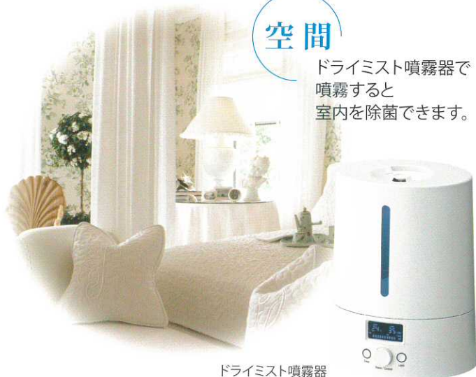
ドライミスト噴霧器